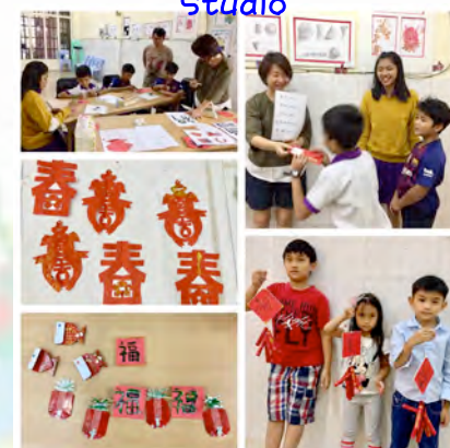
Creative Art Studio