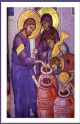
耶穌行第一個神蹟 -- 變水為酒 --