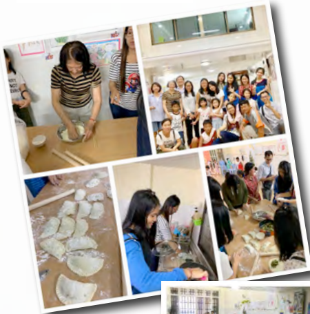
感謝神 去年一整年都有 豐富精彩的活動

因此經由春節由來學生們在動手做剪紙，寫書法等各樣的美勞中認識春節過年的由來，並讓學生知道儘管春節的春聯、紅包等一連串習俗代表不同的祝福意義，那保守我們從歲首到年終的仍舊是那位獨一真神 -- 耶和華。