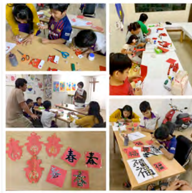
After school program & Chinese Lesson