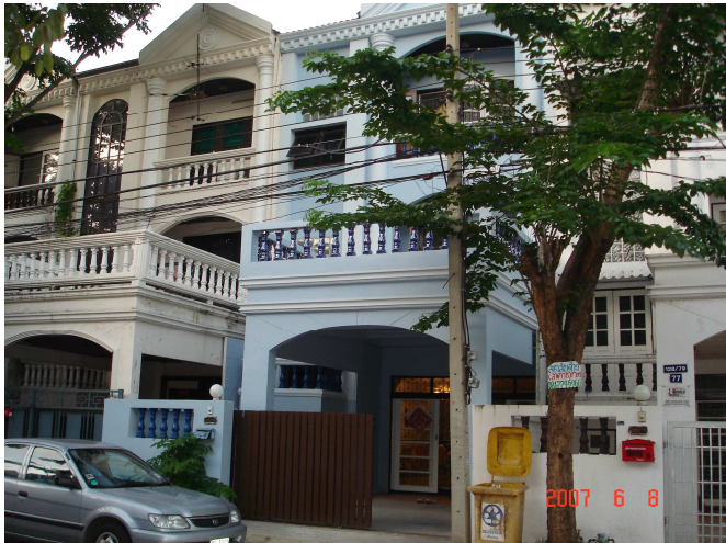
泰國 ABAC 關懷之家外牆照片

我們關注在泰國的中國大陸留學生群體，大約是在五年前從清邁開始，當時在清邁當地讀書的大陸學生以研究生為主，人數也不是太多，隨著她們陸續畢業返國，從 04 年底我們事奉重心，也隨著差會宣教策略漸漸轉移到大曼谷地區，發現曼谷有更大的大陸留學生群體，其中 Abac 大學是人數最集中的一所大學，光是本科生人數就多達兩千餘人，我們心想這個福音的需要量真是大啊！唉！真是心有餘而力不足啊！當時我們清邁、曼