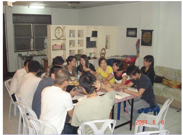
ABAC 大學小組聚會情形

環境中，透過我們愛心與關懷的事奉，以及基督徒生命的見證與傳揚，更容易被吸引來認識主。