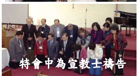
特會中為宣教士禱告