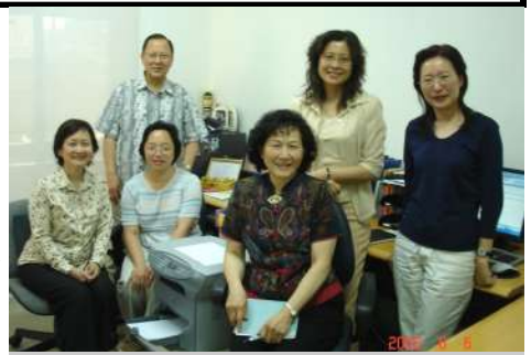
在台灣台北辦公室中，一群可愛的同工們。

在關懷協會的總總，分享不完，雖然今年三月離開了服事的崗位，要用更多的時間配搭家人的需要，但感謝主容讓我每星期有一天進辦公室，看看有什麼地方可以幫忙，也和我親愛的同工們相聚，溫習我們多年來的默契，更讓我得以繼續觀看神在關懷協會的作為，常常預備為祂豐盛的慈愛和保守歡呼。