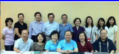
泰國曼谷國際常委會