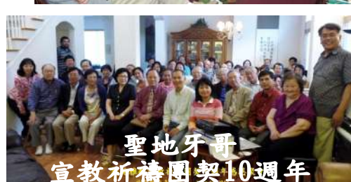
聖地牙哥 宣教祈禱團契10週年