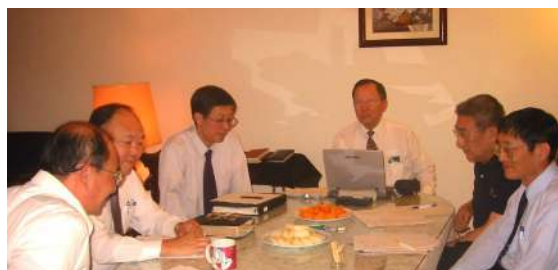
董事會在北美開會情形