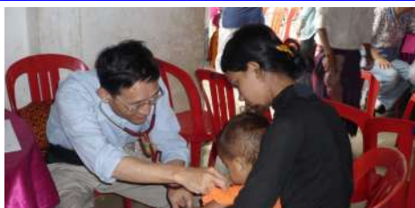
學習耶穌用手觸摸