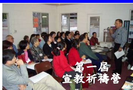
第一屆 宣教祈禱營