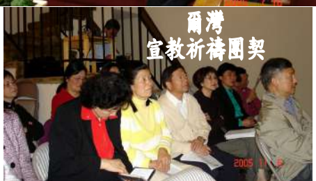
爾灣 宣教祈禱團契