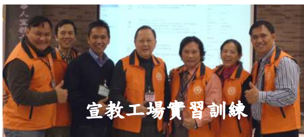
宣教工場實習訓練