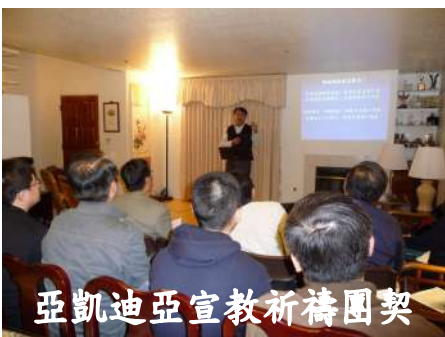
亞凱迪亞宣教祈禱團契