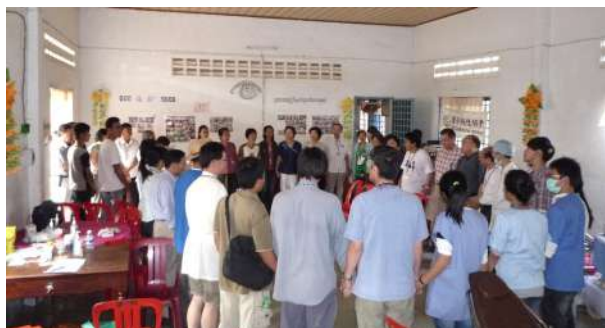
柬埔寨的需要迫切，同工們齊心禱告的照片。

6. 國際NGO成立後，我們希望能向相關企業尋求，供公務使用三部電腦、兩部機車、室內家電等的實物捐贈，或是企業基金會的經費捐贈，若您能提供捐贈管道請與各地國際關懷協會辦公室聯絡。